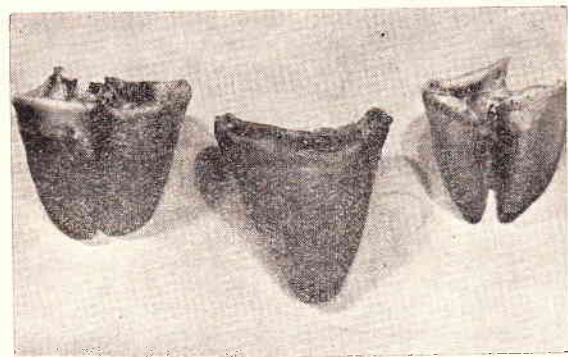
2) Nieprawidłowa jednoraciczna puszka (w środku) po bokach prawidłowe dwuraciczne puszki rogowe u świni.

Sztuka ta razem z innymi została poddana ubojowi. Gdyby Zakłady Mięsne zgodziły się na pozostawienie świni tej (maciorki) przy życiu, mogłaby posłużyć do przeprowadzenia ciekawego doświadczenia, opartego na nauce Miczurina i Lysenki, czy nie dałoby się od świni takiej uzyskać potomstwa o kończynach jednoracicowych, zamiast dwuracicznych.