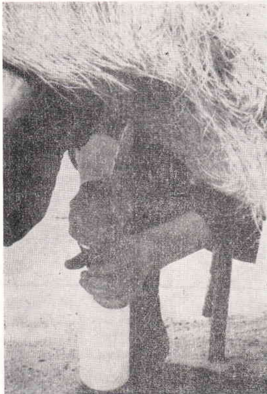
Fot. 1. Pobieranie nasienia od knura na rękę

Przy drugim sposobie pobierania, ejakulację wywoływano stosując ucisk ręki bezpośrednio na prącie. W fazie odruchu szukania, wysuwające się prącie z napletką osłanianą ręką przed otarciem o fantom. Manewr ten ułatwiał chwyt za prącie po zakończeniu ruchów szukających i zajęciu przez knura nieruchomej pozycji na manekinie (zdjęcie nr 1). Wytryskiwane nasienie było pobierane bezpośrednio do plastikowego zbiornika. Przed przystąpieniem do pobierania, natłuszczano rękę niewielką ilości — wazeliny w celu osłony skóry pobierającego przed drażniącym działaniem wydzieliny worka napletkowego.