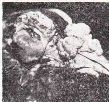
Ryc. 2. Strona chora głowy gołębia

Z prawej strony (ryc. 2) widać zmiany właściwe nowotworzeniu. Dotyczą one dolnej powieki, przykrytej tworem szarym, usadowionym w ubytku jej wolnego brzegu. Nowotwór masą swą ściąga i wywija powiekę ( ectropium ), rozszerza i wydłuża szparę powiekową, przez którą widać w głębi oczodołu zbiełałą rogówkę zanikłej gałki ocznej.