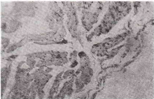
Ryc. 2. Masowa inwazja włókien mięśniowych paszytami Kudoa . Barwienie HE. Pow. 160 X

W zmienionych organoleptycznie wycinkach tkanki mięśniowej morszczuka stwierdzono znaczne uszkodzenia włókien mięśniowych o charakterze litycznym. Znaczna część włókien mięśniowych nie posiada wybarwionej sarkolemy i jąder komórkowych, które prawdopodobnie uległy procesom wstępnym. Obraz poprzecznego prążkowania nie jest zachowany. Stan taki wskazywać może na efekt patologicznego oddziaływania pierwotniaka, jak również może być sygnałem błędów technologicznych przy produkcji zamrażalniczej (5, 6). Topograficzny, mikroskopowy obraz pozwala na stwierdzenie pierwotniaka Kudoa między włóknami mięśniowymi (ryc. 2).