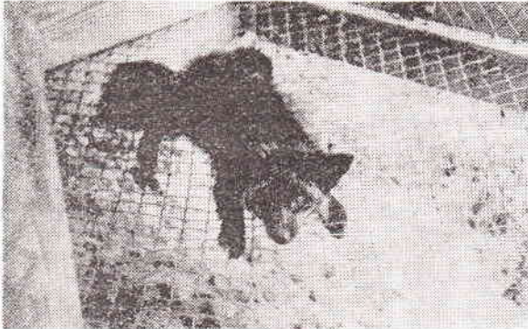
Ryc. 3. Pieśce z objawami „wścieklizny poszczepiennej”

W badaniu laboratoryjnym mózgow i odcinków rdzenia kręgowego reprezentantów zwierząt padłych po przechorowaniu nie wykazano metodą Sellera typowych ciałek Babes-Negriego. Metodą immunofluorescencji (14) stwierdzono w OUN antygen o cechach wirusa ustalonego — szczepionkowego wścieklizny. Wskazywała na to charakterystyczna morfologia świeceni (13, 16). W próbkach biologicznych na myszach okres inkubacji po zakażeniu domózgowym wynosił ca 7 dni, a namnożony wirus wykazywał cechy wirusa ustalonego wścieklizny.