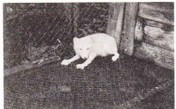
Ryc. 2. Pieśce z objawami „wściekliczyny poszczepiennej”

Notowano nietypowe zmiany sekcyjne: znaczny stopień wychudzenia, brak treści pokarmowej w żołądku, nieżyty i krwawienia do światła żołądka i dwunastnicy, zwyrodnienie mięszone wątroby, obrzęk płuc wylewy krwawe pod-