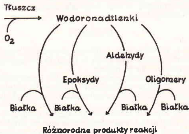
Ryc. 1. Kierunki reakcji produktów utleniania tłuszczów z białkami

Wiąże się to z dość istotną zmianą właściwości technologicznych i żywieniowych białek. W odniesieniu do mięsa można przyjąć, że relacje między zmianami właściwości technologicznych a zmianami właściwości żywieniowych białek mają charakter sprzężeń zwrotnych, przy czym zmiany tych drugich są zawsze nie-