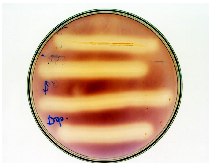
Ryc. 2. Wynik testu na produkcję amylazy przez S. suis – widoczne odbarwienie podłoża wokół kolonii S. suis

i wprowadzano je do bulionu cieleńcego (Difco) z dodatkiem 5% surowicy końskiej (Sigma), po czym inkubowano je w termostacie (37°C, 5% CO 2 ) przez 18 godzin. Następnie hodowlę mieszano na wytrząsarce i poddawano ją wirowaniu (3000 obrotów/minutę, 15 minut, temperatura pokojowa). Do osadu dodawano 2 ml 0,9% roztworu NaCl i mieszano do uzyskania homogennej zawiesiny. Zawiesinę badanego szczepu paciorkowca w płynie fizjologicznym wprowadzano do stelaża z szeregiem probówek, zawierających poszczególne substraty biochemiczne. Stelaże zamykano i inkubowano w termostacie, w warunkach analogicznych do przedstawionych powyżej. Po 4 godzinach inkubacji do studzienki z tabletką VP dodawano po kropli odczynników VP1 oraz VP2 (bioMerieux) i pozostawiano je na 10 minut w temperaturze pokojowej, a następnie dokonywano odczytu testu. Pozostałe reakcje analizowano po 24-godzinnej inkubacji w warunkach jw.