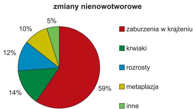
Ryc. 2. Występowanie poszczególnych zmian nienowotworowych śledziony u psów

Krwaki ( hematoma ) stanowiły 14% nienowotworowych zmian w śledzionie i we wszystkich przypadkach były to zmiany guzowate. Krwaki są dość często stwierdzane w materiale przesyłanym do badań histopatologicznych, gdyż niejednokrotnie powodują nagłe i zagrażające życiu objawy kliniczne, które zmuszają lekarza do wykonania zabiegu chirurgicznego. Ponadto, krwaki często współistnieją z innymi procesami chorobowymi w śledzionie lub są stwierdzane przypadkowo podczas laparotomii wykonywanej z innych wskazań (2). Często są one nie do odróżnienia makroskopowo od stwierdzanych u psów nowotworów naczyniopochodnych, a obserwowana niekiedy obecność oderwanych fragmentów krwaka w obrębie krezki czy sieci może sugerować chirurgowi obecność przerzutów naczyniakomięsaka. W takiej sytuacji całkowite usunięcie śledziony i przesłanie materiału do badania histopatologicznego wydaje się najlepszym sposobem postępowania, dlatego że do ostatecznego rozpoznania procesu wymagane jest często badanie licznych wycinków narządu, a ponadto pozostawienie w jamie brzusznej łatwo pękających, kruchych mas grozi tragicznymi w skutkach powikłaniami (2, 11). Obecność krwaków stwierdza się u zwierząt różnych ras, płci i wieku, jednakże niektórzy autorzy sugerują, że częściej u labradorów i osobników w typie tej rasy (2).