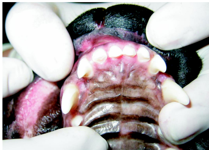
Ryc. 4. Dwie symetryczne odleżyny na błonie śluzowej podniebienia

Podczas zwarcia szczęk stwierdzono kontakt urazowy szczytów koron obu kłów żuchwy z powierzchnią podniebienia, co stało się przyczyną wystąpienia nie gojących się ran (ryc. 5). Pacjent wymagał leczenia ortodontycznego, które doprowadziłoby do korekty nieprawidłowości zgry-