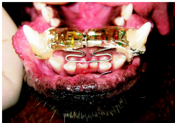
Ryc. 7. Stan po 5 tygodniach leczenia ortodontycznego

zowej i wychylenia kłów w kierunku dowargowym. W tym celu zaprojektowano aparat czynnościowy typu płytki językowej Schwarza, przeciętej w linii środkowej ze śrubą Fischera wmontowaną w miejscu przecięcia płyty akrylowej (ryc. 6).