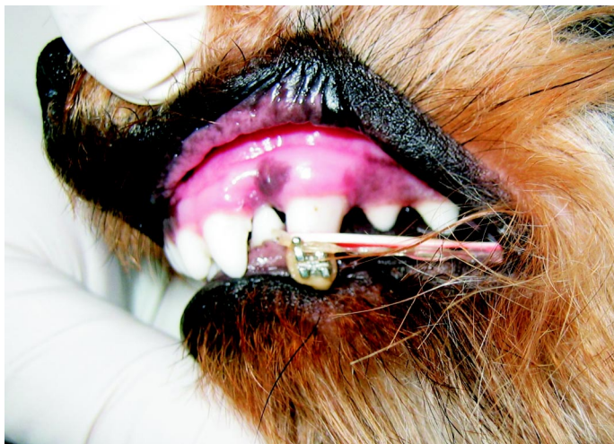
Ryc. 1. Nieprawidłowe ustawienie lewego kła w łuku zębowym szczęki