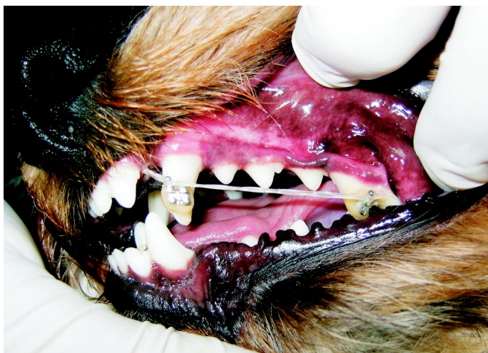
Ryc. 2. Leczenie ortodontyczne (element aparatów stałych)