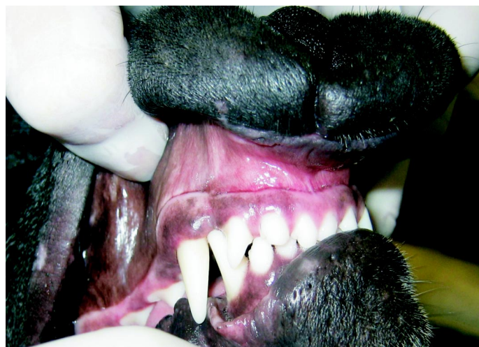
Ryc. 5. Kontakt urazowy szczytów koron obu kłów żuchwy