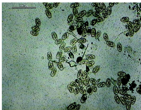
Ryc. 3. Liczne oocysty E. stiedai