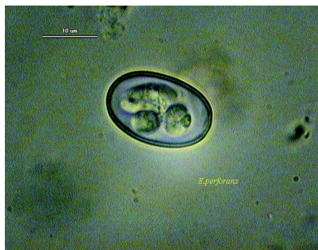
Ryc. 4. Sporulowana oocysta E. perforans