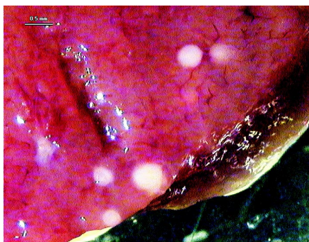
Ryc. 1. Zmiany spowodowane przez E. stiedai w wątrobie królika

U badanych zwierząt dominowały inwazje kokcydiów lokalizujących się w jelitach, u królików z gospodarstw indywidualnych zarażonych było 93-96% zwierząt. Nieco niższa była ekstensywność kokcydiów jelitowych u zwierząt pochodzących z ferm (86%). Znaczący udział w zarażeniu miał także gatunek lokalizujący się w wątrobie ( E. stiedai ). W zależności od gospodarstwa indywidualnego, zarażonych tym pierwotniakiem było od 25% do 60,53% królików. Uzyskane wyniki należy uznać za wiarygodne, uwzględniając różnorodność hodowli indywidualnych, z których pochodziły ubijane zwierzęta. Ekstensywność inwazji E. stiedai u królików z ferm była zdecydowanie niższa od uzyskanej dla dwóch grup zwierząt z gospodarstw indywidualnych (tab. 1 i 2). U badanych królików najrzadziej stwierdzano pojedynczą inwazję E. stiedai lokalizującej się w wątrobie, często natomiast stwierdzano wielogatunkowe inwazje kokcydiów jelitowych lub inwazję mieszaną kokcydiów jelitowych i E. stiedai . Odmienne proporcje ekstensywności inwazji gatunków jelitowych i E. stiedai