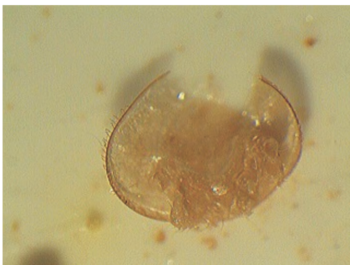
Ryc. 4. Młoda samica Varroa destructor z ułamanym mechanicznie pancerzem