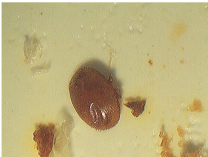
Ryc. 2. Samica Varroa destructor z wgniecionym pancerzem