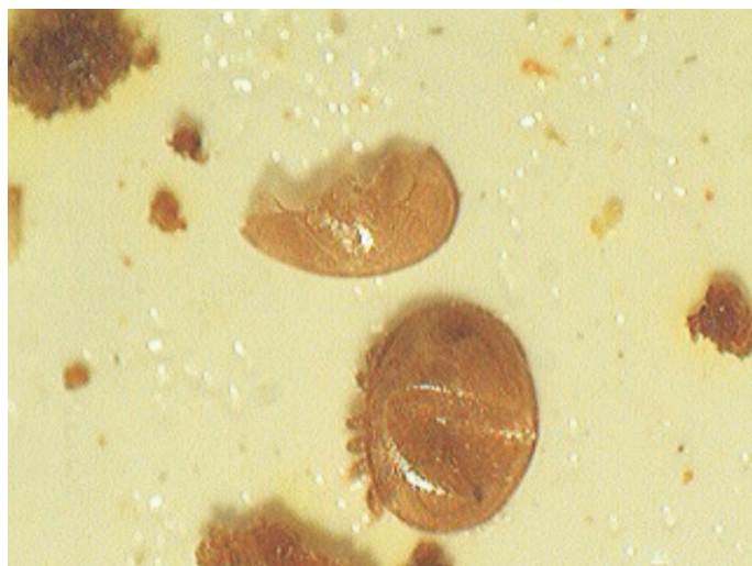
Ryc. 3. Samica Varroa destructor z wgniecionym pancerzem i fragment drugiego pasożyta