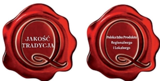
Ryc. 3. Znak systemu Jakość i Tradycja

Drugim krajowym systemem wyróżniania żywności specjalnej jakości jest system Jakość i Tradycja (JT) który opracowany został przez Polską Izbę Produktu Regionalnego i Lokalnego oraz Związek Województw Rzeczypospolitej Polskiej. Minister Rolnictwa i Rozwoju Wsi 12 czerwca 2007 r. podjął decyzję o uznaniu tego systemu za krajowy system jakości żywności. Produkty zgłaszane do udziału w systemie JT muszą zostać wyprodukowane przy użyciu naturalnych surowców, identyfikowalnych, nie zawierających GMO. Ponadto produkty te mają posiadać szczególną jakość lub reputację odróżniającą je od produktów należących do tej samej kategorii. Dodatkowe wymagania dotyczą tradycyjnych produktów produkcji podstawowej. Za tradycyjną uznaje się odmianę roślin czy też rasę zwierząt, które użytkowano przed 1956 r. Producenci występujący o zarejestrowanie w systemie JT muszą złożyć wymagane regulaminem dokumenty, w tym specyfikację produktu. Produkt podlega szczegółowej weryfikacji zgodnie z Regulaminem Znak, który został przyjęty przez Urząd Patentowy Rzeczypospolitej Polskiej (ryc. 3). Znak Jakość Tradycja jest znakiem zarejestrowanym w Urzędzie Patentowym i chronionym zgodnie z prawem własności przemysłowej. W systemie zarejestrowało dotychczas swoje produkty 76 producentów, w tym PPMG „Galicja” Sp. z o.o., której znakiem JT wyróżniono 6 produktów na ogólną liczbę 126.