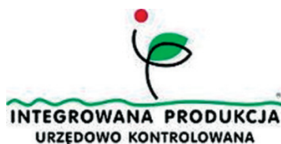
Ryc. 2. Znak nadawany produktom wytwarzanym w ramach systemu jakości Integrowana Produkcja

Drugim krajowym systemem wyróżniania żywności specjalnej jakości jest system Jakość i Tradycja (JT) który opracowany został przez Polską Izbę Produktu Regionalnego i Lokalnego oraz Związek Województw Rzeczypospolitej Polskiej. Minister Rolnictwa i Rozwoju Wsi 12 czerwca 2007 r. podjął decyzję o uznaniu tego systemu za krajowy system jakości żywności. Produkty zgłaszane do udziału w systemie JT muszą zostać wyprodukowane przy użyciu naturalnych surowców, identyfikowalnych, nie zawierających GMO. Ponadto produkty te mają posiadać szczególną jakość lub reputację odróżniającą je od produktów należących do tej samej kategorii. Dodatkowe wymagania dotyczą tradycyjnych produktów produkcji podstawowej. Za tradycyjną uznaje się odmianę roślin czy też rasę zwierząt, które użytkowano przed 1956 r. Producenci występujący o zarejestrowanie w systemie JT muszą złożyć wymagane regulaminem dokumenty, w tym specyfikację produktu. Produkt podlega szczegółowej weryfikacji zgodnie z Regulaminem Znak, który został przyjęty przez Urząd Patentowy Rzeczypospolitej Polskiej (ryc. 3). Znak Jakość Tradycja jest znakiem zarejestrowanym w Urzędzie Patentowym i chronionym zgodnie z prawem własności przemysłowej. W systemie zarejestrowało dotychczas swoje produkty 76 producentów, w tym PPMG „Galicja” Sp. z o.o., której znakiem JT wyróżniono 6 produktów na ogólną liczbę 126.