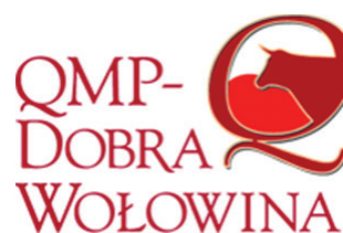
Ryc. 4. Znak systemu jakości wołowiny Quality Meat Program

Polskie Zrzeszenie Producentów Bydła Mięsnego jest autorem opracowanego systemu QMP (Quality Meat Program). W 2008 r. został on oficjalnie uznany przez Ministra Rolnictwa i Rozwoju Wsi za jeden z krajowych systemów jakości żywności. System QMP jest zbiorem zasad, określających cały proces produkcji mięsa wołowego, od wskazania ras bydła na najlepsze mięso, po sposób jego pakowania i oznakowania.