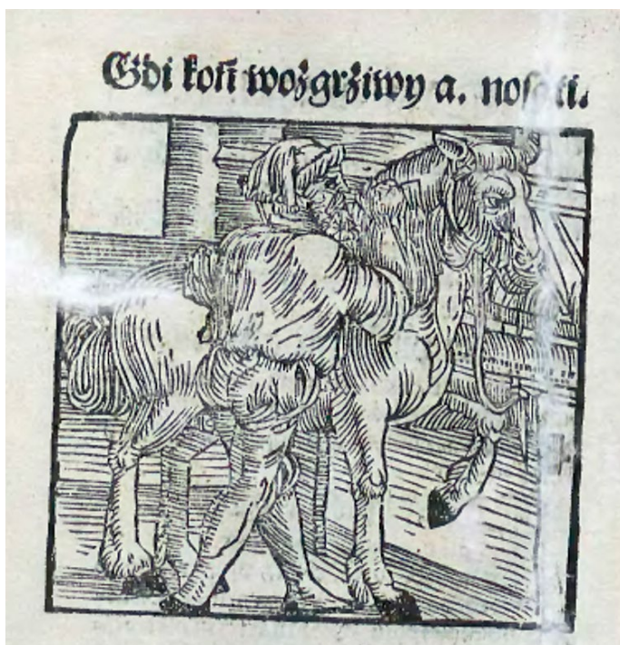
Ryc. 1. Zabiegi lecznicze – drzeworyt z dzieła „Sprawa a lekarstwa końskie...”, Kraków, 1532.

Polskie piśmiennictwo dotyczące lecznictwa zwierząt narodziło się w pierwszej połowie XVI w. Pierwszą książką w języku polskim dotyczącą tej tematyki jest wydane w Krakowie w 1532 r. anonimowe dzieło zatytułowane „Sprawa a lekarstwa końskie przez Conrada Królewskiego kowala doświadczone: nowo s pilnoscia przełożone, a napirwey o poznaniu dobrego konia” (we wszystkich tytułach i cytatach przytoczonych w niniejszym artykule zachowano pisownię oryginalną) (ryc. 1). W dziele tym bardzo często jako środki terapeutyczne pojawiają się kuracje oparte o magię i czary. Należy podkreślić, że te zabiegi i środki można przyporządkować do kilku typów. Pierwszym